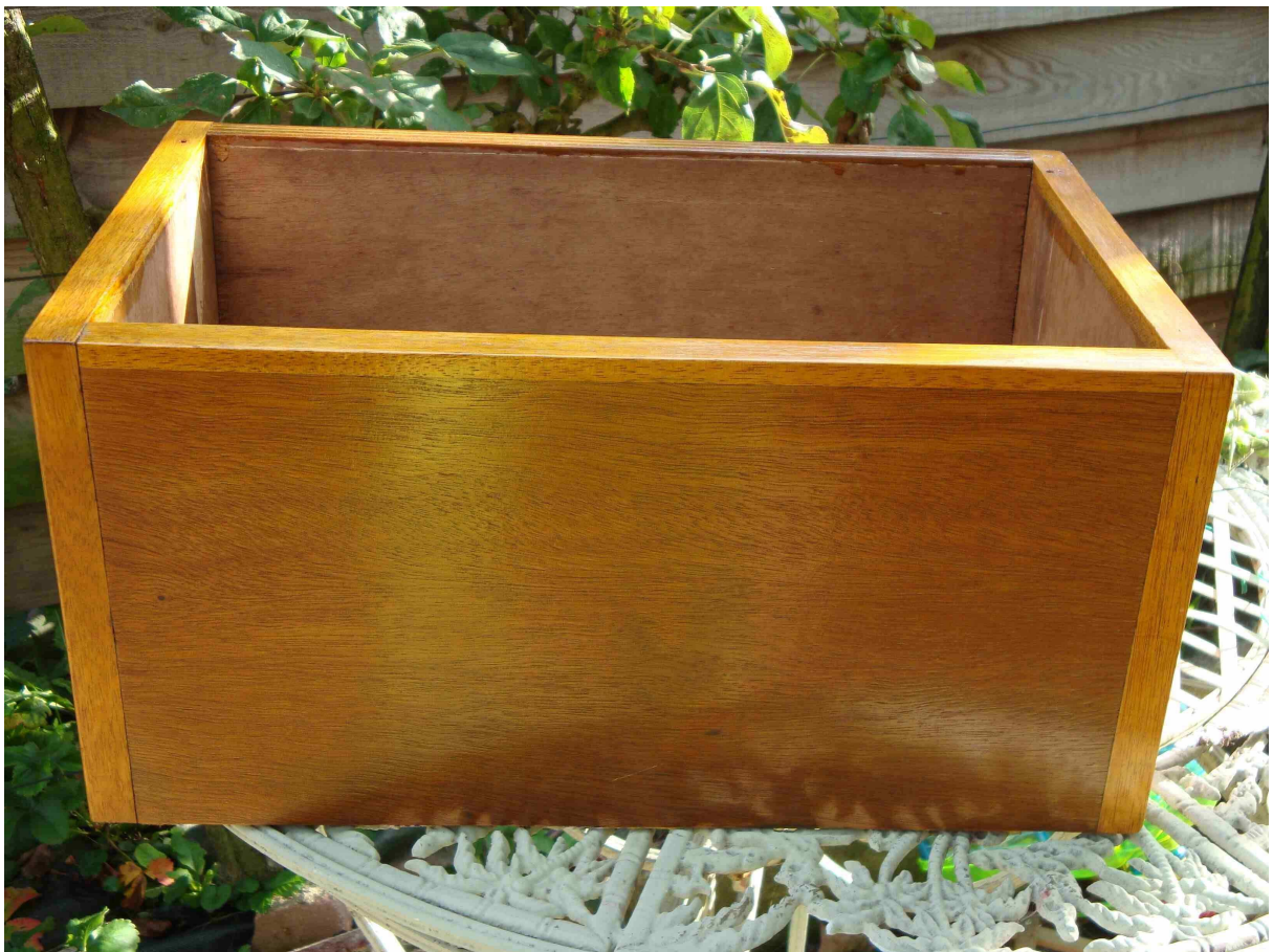
Application du Cétol nature (3 couches) sur le bois blanc, cela donne une couleur dorée assez jaune.