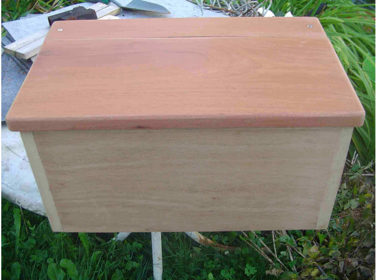
Entièrement poncé et après 3 applications du dégriseur, disparition des taches noires.