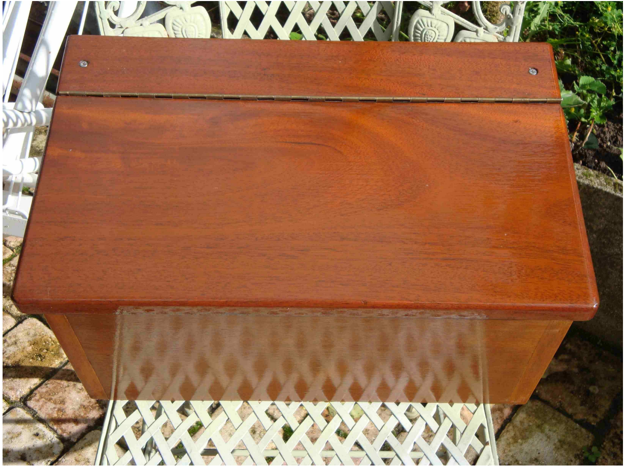
Application du Cétol Teck seul sur le dessus.