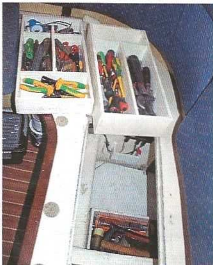
▲ Cyrille (voir l'encadré en fin d'article) a fabriqué des caisses à outils à la cote précise des coffres de son Fabulo 35. Pipe en haut !