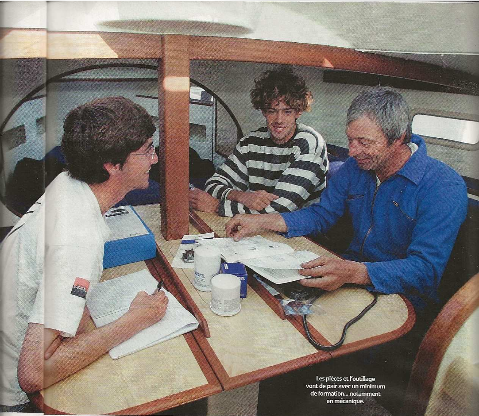
Les pièces et l'outillage vont de pair avec un minimum de formation... notamment en mécanique.