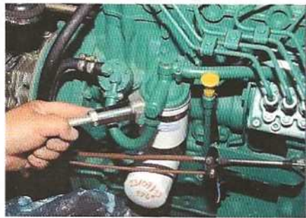
▲ Une clé filtre c'est bien, mais on peut faire sans... avec une pince-étoupe par exemple.

Si vous êtes imprévoyant, vous risquez des problèmes. Mais si vous êtes trop stressé, vous allez crouler sous les pièces détachées ! Sachez placer le curseur et n'oubliez pas que vous pouvez faire pas mal d'escalas techniques bien achalandées sur un tour de l'Atlantique. Madère, Gran Canaria, la Martinique, les Açores... Les garages ne manquent pas sur la route !