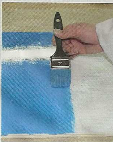
▲ Un bon pinceau est un pinceau adapté à la surface... qui ne sème pas de soies en route !

De toute évidence, le chapitre résine et stratification concerne en premier lieu les bateaux en composite. Mais quel que soit le matériau de votre coque, un renfort en fibre de verre peut rendre de grands services sur le pont ou dans les emménagements. Quant à la peinture, elle est omniprésente à bord... Et que dire du Sika ? Le célèbre mastic polyuréthane, qui permet de tout coller et tout étancher, est aussi nécessaire au marin en voyage que le vent et l'eau... A condition de savoir s'en servir. Sur bien des bateaux, la bouteille d'acétone n'est jamais très loin non plus. Dès qu'il faut dégraisser avant collage, nettoyer un peu de résine qui colle... Mais attention, ses vapeurs sont toxiques. Idem quand vous poncez de la fibre : on se protège.