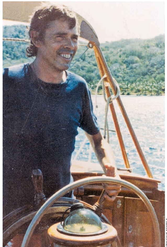
VZW SAVE ASKØY II

C'est ainsi qu'il fait construire l' Askøy II sur ses plans repris et tracés par Raymond Derkinderen au chantier anversois Van de Voorde, yawl lancé le 19 mars 1960. C'est un long et lourd bateau de 18,66 mètres pour 40 tonnes, construit en acier de 4 à 5 millimètres