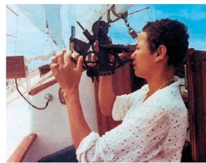
VZW SAVE ASKØY II

Ils ne sont plus que trois à bord : le chanteur, sa compagne et sa fille. Inca-