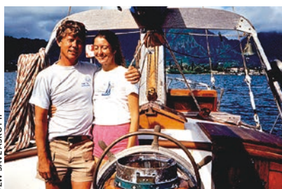
VZW SAVE ASKØY II