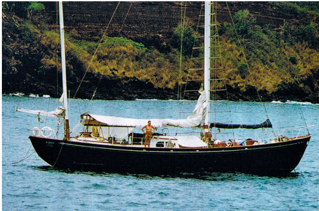
VZW SAVE ASKØY II

“ Putain, les Antilles sont belles Elles vous croquent sous la dent On se coucherait bien sur elles Mais repartez de l'avant Car toutes cloches en branle-bas Votre cathédrale se voile Transpercera le canal Le canal de Panama ”