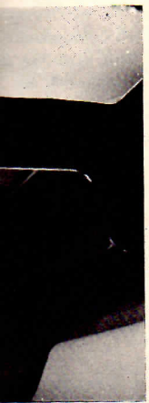
on ne peut, ap- rrapper la drisse, ob- sandoms où l'o- lâcher la drisse, en- Signations, en- ment de la bô- présence d'un fi- bord devrait re- d'une chaîne. Si l'on n'y veill-