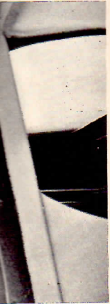
Le colli- coulis- chère